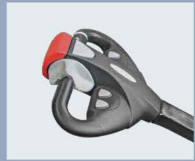
Timón de marca Rema