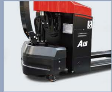
Dispone de ruedas auxiliares para una mayor estabilidad