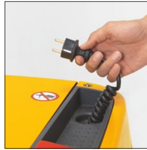
Cargador integrado también para baterías más grandes