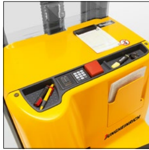
Diversas bandejas cubeta para tener los utensilios de trabajo a mano